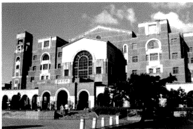
國立臺灣大學總圖書館

臺大一向致力於追求學術思想自由、提升台灣高深學術研究及教學，目前正朝世界一流大學方向努力。2008 年，被西班牙國家研究委員會全球資訊網(Webometrics)評為世界前 100 名大學，名列 73 位，亞洲第 2。2007 年，被英國《泰晤士報》高等教育副刊評為全球前 200 名的大學，名列 109 位。